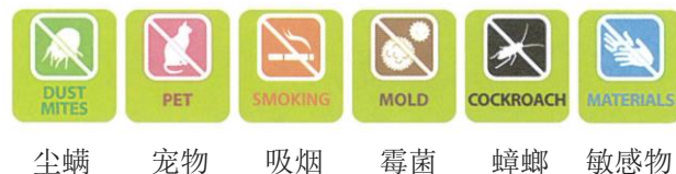
尘螨 宠物 吸烟 霉菌 蟑螂 敏感物